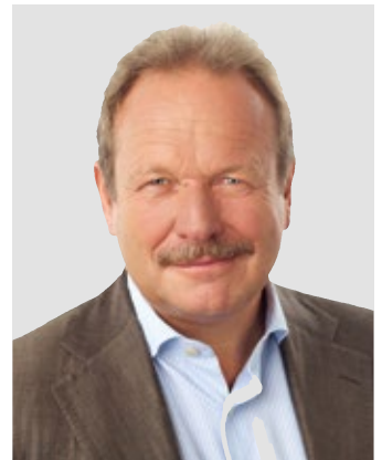
Frank Bsirske ver.di-Vorsitzender

„Die Mitglieder haben entschieden. Sie lehnen die Schlichtungsempfehlung ab und sind mit großer Mehrheit bereit, weiter zu streiken. Das ist ein klares Signal an ihre Gewerkschaft, an die Arbeitgeber und auch an die Eltern. Jetzt sind die Arbeitgeber gefragt.“