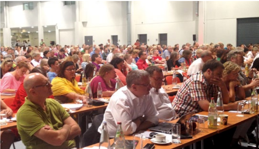
Die Streikdelegierten diskutieren auf ihrer Versammlung am 8. August 2015 in Fulda über die Fortsetzung des Streiks.